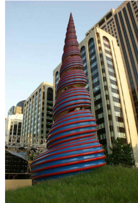
2. 서울 청계천에 설치된 올덴버그의 설치작품