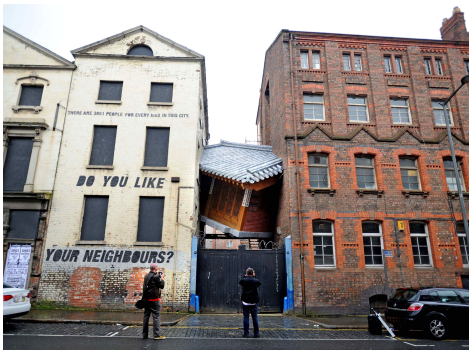
1. 리버풀에 설치된 서도호의 작품

1. 다음 설치작업의 사진들은 두 다른 문화들의 공존을 보여준다. 이를 비교하여 자유롭게 설명하시오.