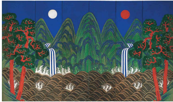
<일월 오봉도>, 조선시대 (18세기 말~19세기)