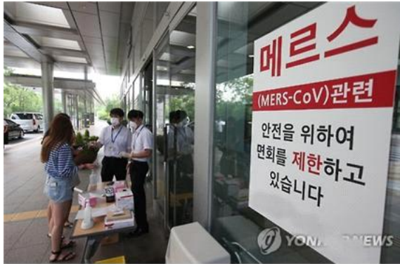
▲ 메르스 발생 관련